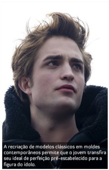
A recriação de modelos clássicos em moldes contemporâneos permite que o jovem transfira seu ideal de perfeição pré-estabelecido para a figura do ídolo.

Quando o adolescente se depara com algo ou alguém indo contra o ídolo (contra os livros, nesse caso), contra o modelo de identidade que ele está tentando criar, desencadeia-se uma reação de total confusão, que começa com o medo de estar errado, passa pela raiva e culmina com a total negação da crítica. Além de tudo isso, existe mais um ponto: e os adultos que gostam da série? Qual a explicação para isso? Primeiramente vale ressaltar que são bem mais raras as respostas violentas às críticas partindo de um adulto, mas elas ainda existem. O grande motivo para adultos gostarem desse tipo de livro é basicamente o mesmo: a busca da identidade, que nesses casos foi um conflito não superado na adolescência.